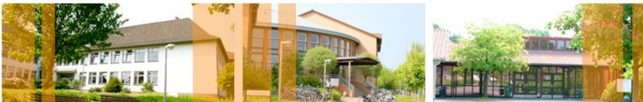
Berufsbildende Schulen Syke